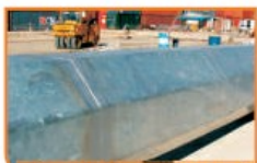
Reparación de galvanizado