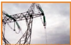
Torres de A.T.